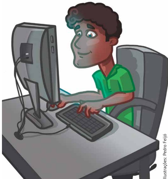
Ilustrações: Pedro Feijó

O Portal do Aluno é o espaço dedicado a sua vida acadêmica. Lá estão informações como o horário individual, histórico parcial e a grade do curso. É nele que são feitas as solicitações e confirmações de matrícula nas disciplinas. Para