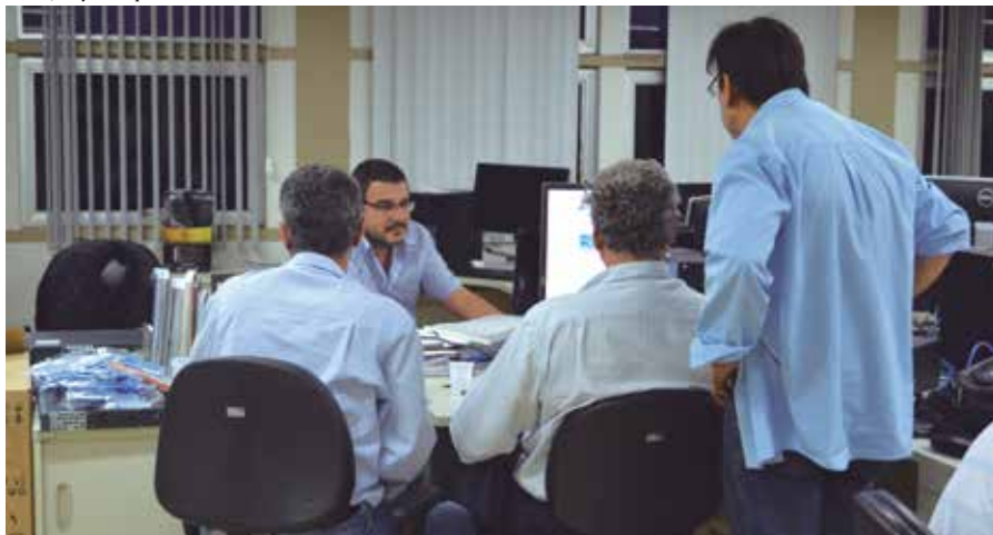
Equipe do NTI: trabalho para ampliar o acesso à internet em conformidade com o Marco Civil